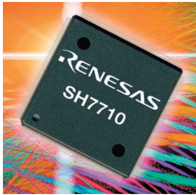
Рисунок 1 Микропроцессор SH7710 для цифровой обработки сигналов с поддержкой двух Ethernet каналов

Представителями другого направления являются серии процессоров SH-3 , SH-4 , а также вариант с более мощным ядром — SH-4A (Суперскалярное ядро). Микропроцессоры, входящие в эти серии, в первую очередь предназначены для работы в мобильных устройствах, сетевых системах и других приложениях требующих высокоскоростной обработки данных.