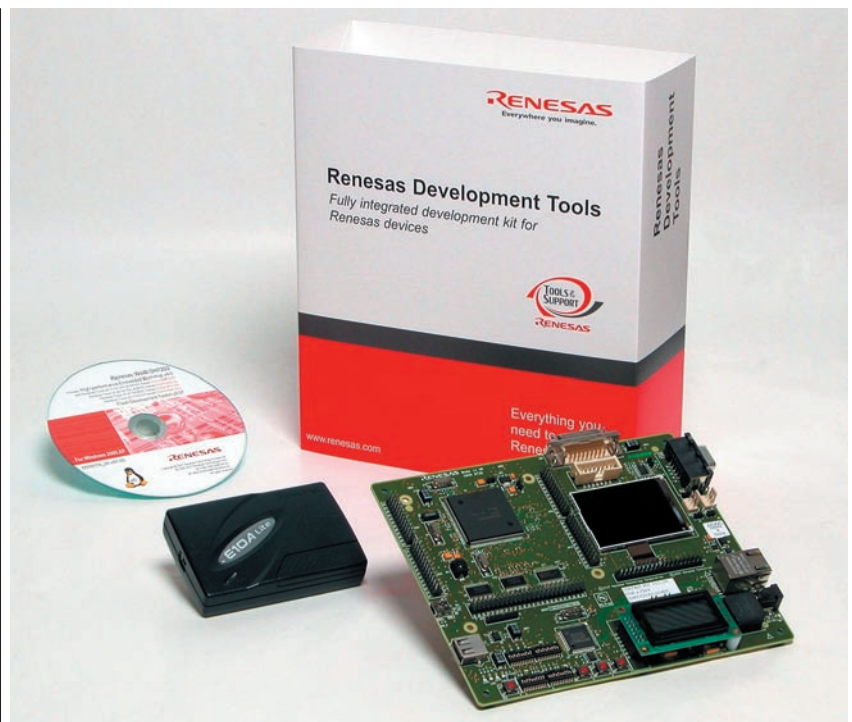
Рисунок 4 Отладочный комплект с эмулятором E10A

Главным звеном в разработке программного обеспечения микроконтроллеров является уникальное предложение компании высокоэффективная среда разработки ПО — High-performance Embedded Workshop (HEW), универсальная для всех микроконтроллеров компании Renesas Technology. Она представляет собой графическую среду