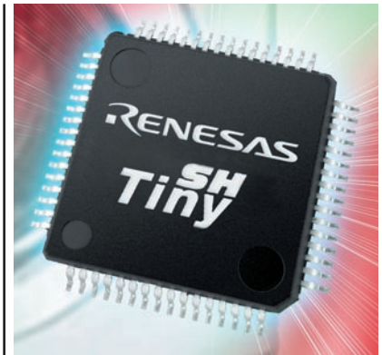
Рисунок 2 Микроконтроллер бюджетной серии SH-Tiny

Для достижения высокой плотности программного кода SuperH работает с 16-разрядными RISC командами, в то время как традиционная 32-битная RISC архитектура использует всю длину 32-разрядной инструкции. Благодаря применению здесь 16-разрядных команд размер результирующего