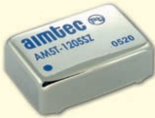
Рисунок 2 DC/DC преобразователь AM5T-1205SZ

(UPS), который обеспечит резервное питание от аккумулятора, при отключении от сети переменного тока.